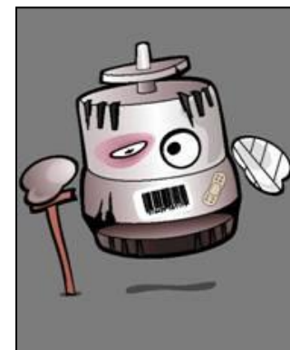
Piese lipsă sau deteriorate in componența piesei vechi